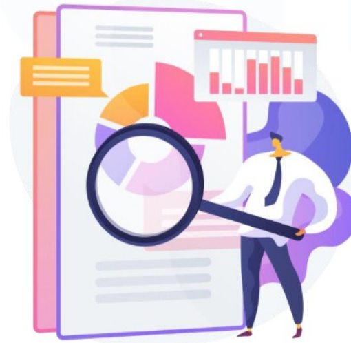
Imagen - Auditoría

Revisa que las obras públicas ejecutadas se realizaron conforme a los proyectos, programas, presupuestos, especificaciones y costos estipulados en los contratos correspondientes y que los contratos se hayan celebrado de acuerdo con las normas y leyes aplicables.